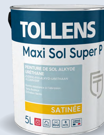
Intérieur et extérieur