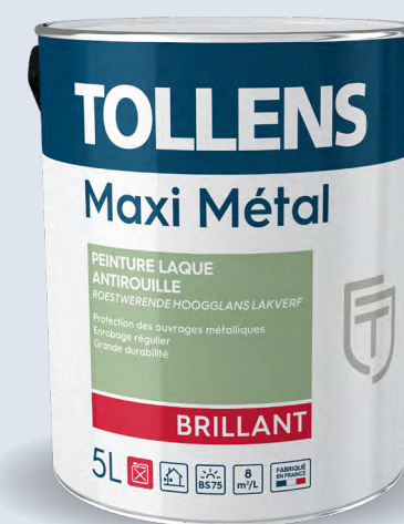
2 en 1 antirouille