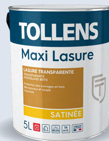
Teintable & Hydrofuge